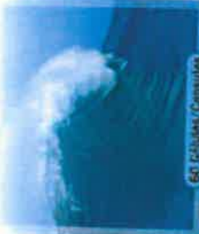
60 Gélules / Capsules

Complément alimentaire à base de Magnésium, Mélinis, et Vitamine B6 / Food supplement with Magnesium, Lemon balm and Vitamin B6.